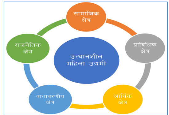
चित्र नं. १: अनुसन्धानको उत्थानशीलता प्रारूप

राष्ट्रिय तथा अन्तर्राष्ट्रिय अभ्यासको सिकाइबाट सुसूचित हुँदै यो अनुसन्धानको सैद्धान्तिक प्रारूप तयार गरिएको छ । यो प्रारूप तयार गर्दा अन्तर्राष्ट्रिय खाद्य नीति अनुसन्धान केन्द्र र अक्सफामद्वारा सुभाइएका महिलाको आर्थिक सशक्तिकरणका प्रारूपलाई मुख्य आधार बनाइएको छ । यी प्रारूपहरूले महिला संलग्न उद्यम उत्थानशील हुनका लागि सामाजिक, राजनैतिक, वातावरणीय, आर्थिक र प्राविधिक गरी पाँच मुख्य क्षेत्रहरू औल्याएका छन् (चित्र नं. १ हेर्नुहोस) । यस अध्ययनमा यी पाँचै क्षेत्रहरूको समग्र विप्लेषण गर्दै नीति र अभ्यासहरूमा देखिएका लैंगिक विभेद र अवरोधहरू पहिचान गर्ने र ती अवरोधहरू हटाउँदा सम्बन्धित महिला र सम्बद्ध सबै सरोकारवालाहरू समेतको सहकार्यमा कार्यमूलक अनुसन्धान अघि बढाउने रणनीति लिइएको छ ।