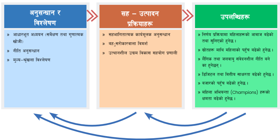
चित्र नं. २: अनुसन्धान पद्धति

यस परियोजनाले विश्लेषणात्मक तथा सहभागितात्मक कार्यमूलक अनुसन्धान पद्धति अनुसरण गरेको छ । यो अनुसन्धान पद्धतिमा कृषि तथा वनजन्य उत्पादन मूल्य श्रृंखलामा सहभागी महिलाले भोग्नुपरेका लैंगिक अवरोधहरू पहिचान गर्न तथा पहिचान गरिएका अवरोधहरू हटाउनका लागि उद्यम विकास एउटा महत्वपूर्ण कोसेढुङ्गा हुने विश्वास गरिएको छ । यो पद्धति उद्यम विकास सहयोग प्रणालीको समग्र वातावरणको विकासमा सान्दर्भिक रहेको छ (चित्र नं. २ हेर्नुहोस) । महिलाको आर्थिक सशक्तिकरणका लागि गरिने हस्तक्षेपका उपायहरू सुधारात्मक तथा हस्तक्षेपकारी (Assertive) दुवै किसिमका हुनेछन् । यी उपायहरू महिलाले भोग्नुपरेका अवरोध हटाई उत्थानशील उद्यम विकासको वातावरण बनाउनका लागि आवश्यक पर्ने नीतिनिर्माण तथा व्यावहारिक अभ्यासमा सुधार गर्न महत्वपूर्ण हुनेछन् ।